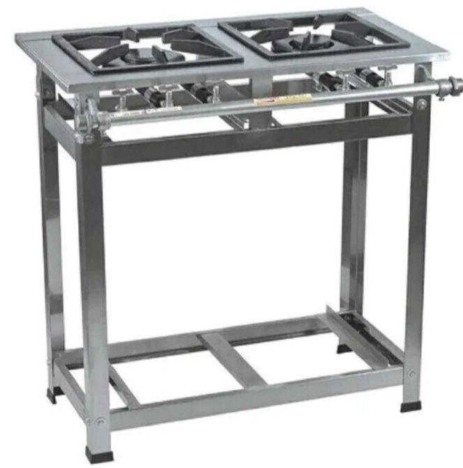
Imagem de referência.