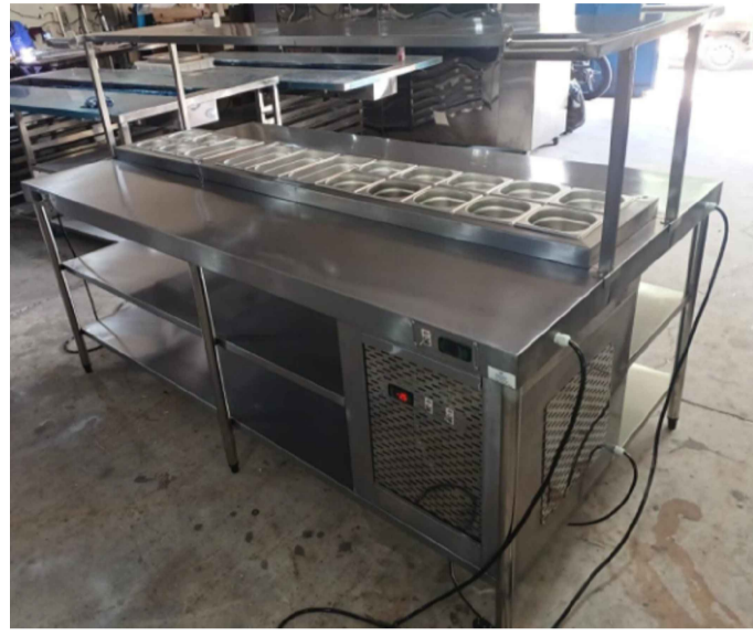
Imagem de referência.