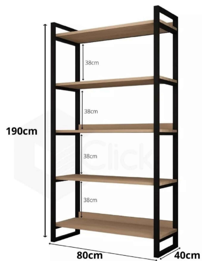
Imagem de referência.