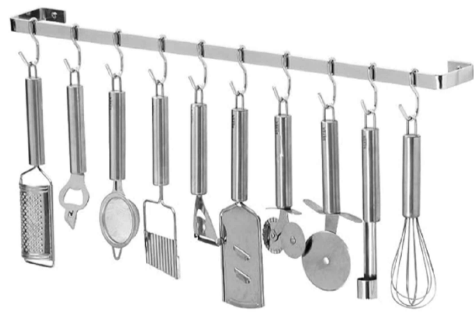
Imagem de referência.