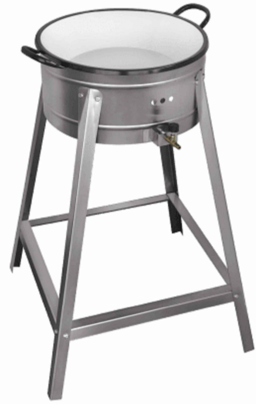
Imagem de referência.