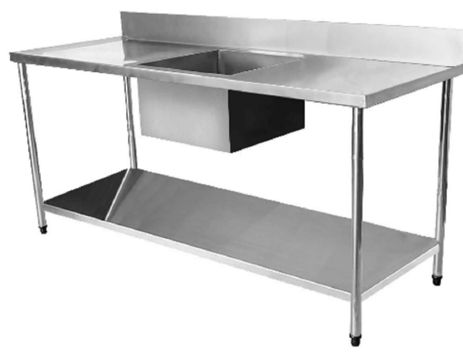
Imagem de referência.